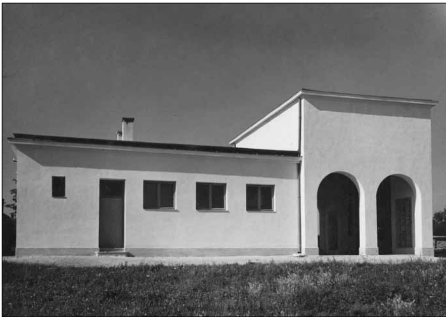
15. kép. Zsidó temetőcsarnok, a mártírok emlékfalával (1948), Magyar Építészeti Múzeum Fotótára

(1954). 77 1959-ben Füredi tervei alapján építették be a háborúban elpusztult Templom utca 24. sz. ház lerombolásával szabaddá vált telket is. Az utcatorkolat régi, íves barokk kompozícióját egy modernebb, szögletes és árkádós kialakítás váltotta fel. Az épület szintenként három (egy utcára, egy udvarra néző és egy átmenő), összesen 12 lakást tartalmaz. A két szomszédos épület eltérő homlokzati síkjának adottságát a tervező az épület alaprajzában építészeti erénnyé kovácsolta: az árkádós bejáratot és a lépcsőházat helyezte el itt. A keskeny, ablaktalan déli homlokfalat mészkőből faragott, gitáros leányt ábrázoló szobor díszíti. 78