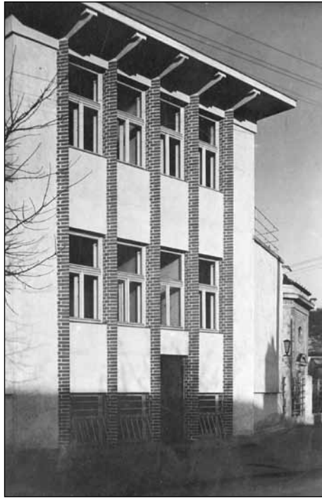
5. kép. Soproni Zsidó Polgári Otthon (1931)

va. Ez a tagolás illeszti az épületet környezetébe. 38 A lapos tetős tömegekből megformált saroképületnek a homlokzatok elé túlnyúló párkánya, valamint a különböző méretű nyílászárók harmonikus rendje ad modern karaktert. Máig megnyerő látvány a Mikoviny út 40. szám alatti, háromszintes – Horn Vilmos számára tervezett – ún. Horn-villa, a Winkler utcára néző, markáns ívű teraszával (7. kép). Az 1934-ben épült, lejtős terepre illeszkedő lakóépület fő tömegét a tervező kontytetővel fedte, azonban a Mikoviny utca felé néző, látszó téglapillérekre állított kisebb épülettömeg – a tömör mellvédes terrasszal fedett konyha-tömb – igazán modern külsőt ad a háznak. A nyílászárók külső árnyékolását – a tervező által gyakran alkalmazott – fa spaletták biztosítják. Kubinszky Mihály szerint: „Ezzel az épülettel vonult be Sopronba a kiérett modern családi ház építés”. 39 Mindkét lakóépület fotóit, jellemző alaprajzát 1935-ben leköszölte a Tér és Forma építészeti folyóirat. 40