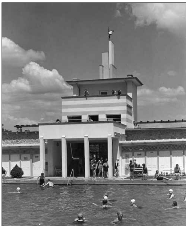
8. kép. A Löver uszoda (1934) bejárati épülete a medence felől.

szellemmel, a munkával, az odaadással pótolja. ” írta a lap kritikusa. 44 Az épület sajnos az 1944. december 18-i amerikai bombatámadás következtében elpusztult. 45