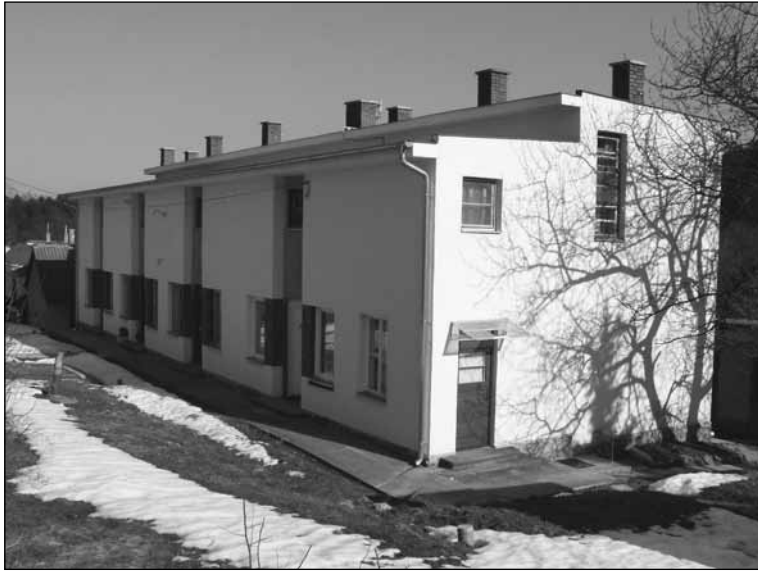
4. kép. Bányász nyugdíjas sorház, Görbehalom-telep 18. (1932 körül)

múzeumot, irodát helyezett el. A templommal szemben lévő dombtetőn kőből rakott, két harangot tartalmazó evangélikus harangláb 1938-ban épült. 32