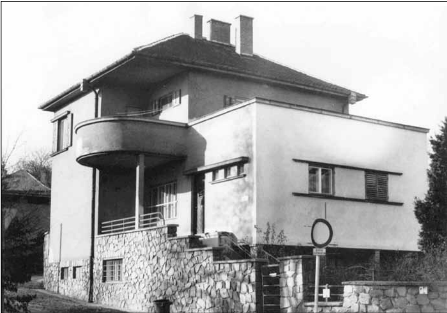
7. kép. A Horn-villa (1934) a Winkler út elején.