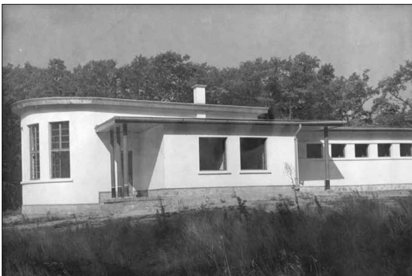
9. kép. A Magyar Ifjúsági Vöröskereszt üdülőlháza (1934)

megnyitása az impozáns látvány felé egy kis erkélyes terasszal. A Tér és Forma szaklap 1938-ban bemutatta a penzió alaprajzait, és a megvalósult állapotot összesen kilenc (négy külső és öt belső) fotóval. 47 A lap leköszölte Füredinek az ebédlőbe tervezett, egyedi mennyezeti lámpáját is.