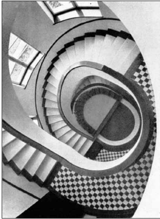
14. kép. A Deák tér 49. bérház lépcsőháza (1938)

A következő évben, 1938-ban két olyan, többlakásos lakóépülete (bérháza) épült fel a Deák téren, melyeket a Tér és Forma építészeti szakfolyóirat bemutatót – szintén a megvalósulás évében. 60 Az egyik a Deák tér 49. számú, háromszintes lakóház, amely a Deák tér északi térsorába illeszkedik, szintenként jobb és baloldalon két nagy és az emeleteken közepén egy kisebb lakással. Az épület utcai homlokzata, alaprajza tengely-szimmetrikus, U alakú beépítésével mélyen benyúlik a telekre. A nyújtott kör alaprajzú lépcsőház Sopron legszebben megkomponált modern kori lépcsőháza, melynek építészeti szépsége Füredi belsőépítészeti tehetségét mutatja (14. kép).