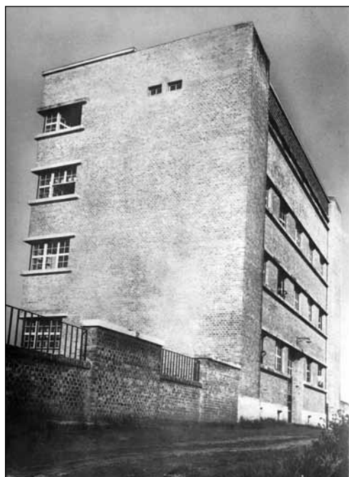
2. kép. A Trebitsch-féle munkáslakóház (1925)