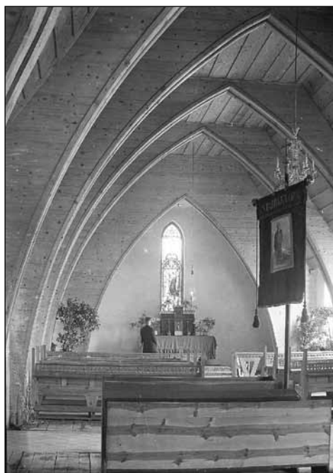
3. kép. Római katolikus templombelső, Brennebergbánya (1930)

Füredi tervezésében a hat tantermes népiskola Brennebergbányán 1925–27 között, majd ezt követően a 108 gyermek befogadására alkalmas óvoda 1928-ban. 30