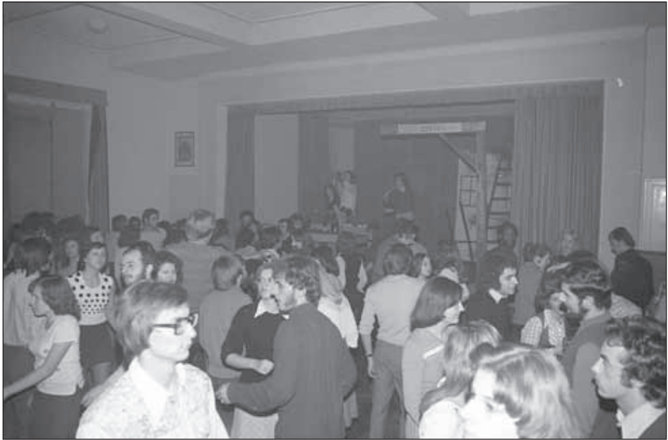
7. kép. Szombat este a KISZ-házban.