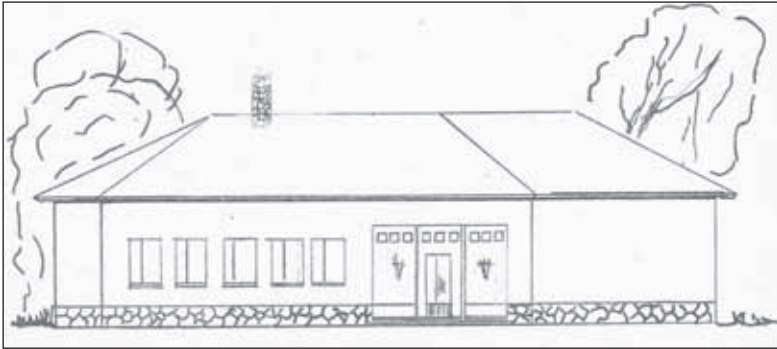
2. kép. Az „egyetemi club” homlokzatterve. Eredeti tervek: Magyar Nemzeti Levéltár Győr-Moson-Sopron Megye Soproni Levéltára, 15129/1958. (Digitalizált másolat: SOE KL).