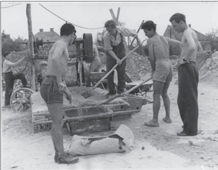
3. kép. A KISZ-ház építése.

Míg a diákok a nyári szünidőt töltötték, az építkezés töretlenül haladt, tető alá hozták a klubház épületét, sőt megkezdődött a belső munkák kivitelezése is. Őstől a munkaerő hiánya is mérséklődött, hiszen visszatértek az építőipari vállalat munkásai a nyári szabadságukról, így ismét teljes erővel folytatódtak a munkálatok. Örömmel számol be a főiskola diáksága a pénzügyi nehézségek sikeres leküzdéséről, így már csak az volt a kérdés, hogy a kivitelező vállalat eleget tud-e tenni ígéretének, miszerint az épület 1958. novem-