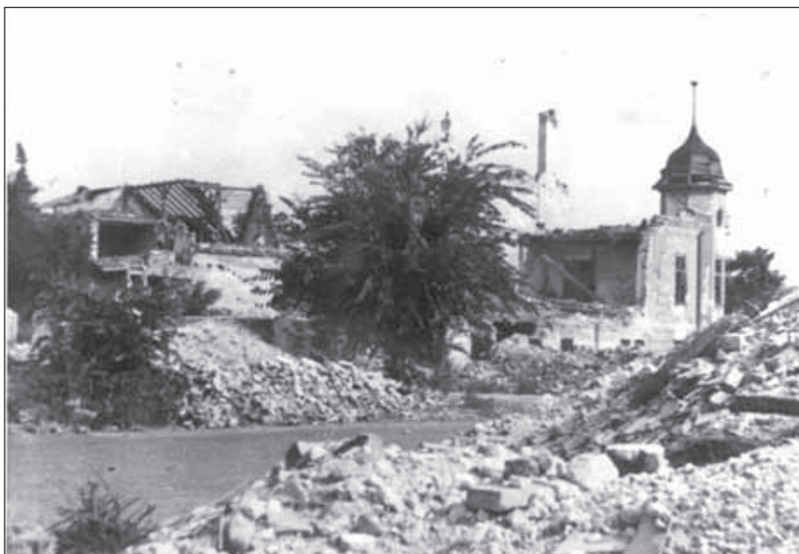
1. kép. Polgári ház a II. világháborús bombázást követően a soproni Hunyadi utca és a Béke út sarkán.