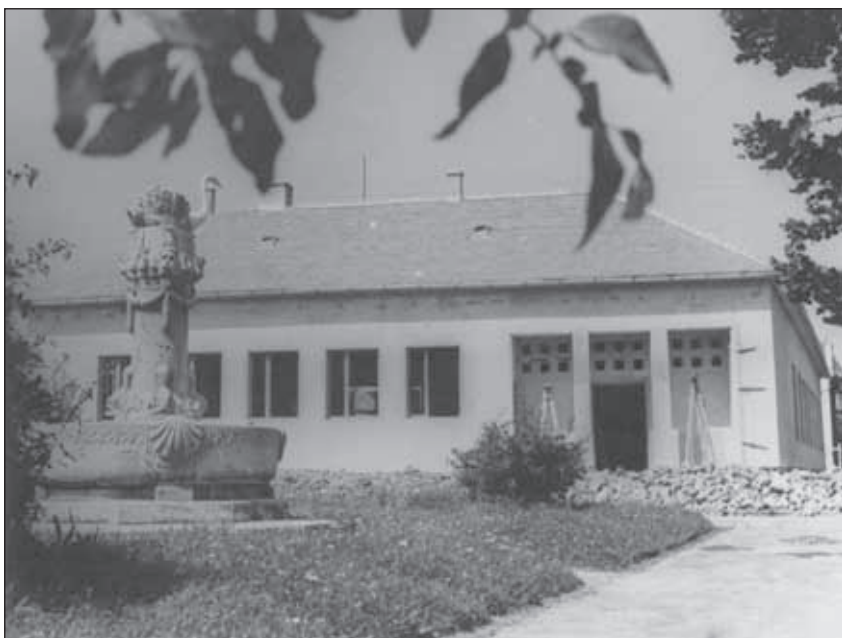
5. kép. A KISZ-ház építése.

kiválóan alkalmassá válhatott – mind kialakítása, mind pedig berendezése szempontjából – nagyobb rendezvények megtartására is. A televíziós szoba 30 néző számára kínált kapcsolódási lehetőséget egy televízióval és egy zeneszekerénnyel. A fentiek alapján okkal adott hangot a hallgatóság azon szívbeli reményének, miszerint még az 1958-as évben teret kaphat a KISZ-házban az ifjúsági élet. 13