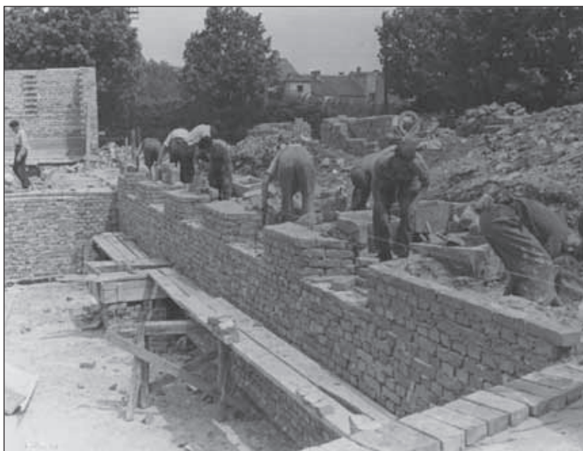
4. kép. A KISZ-ház falazása.

ber 7-ére készül. 11 A munkálatok előrehaladtával az ifjúság társadalmi munkában elsősorban az udvaron és az utcán visszamaradt törmelék eltávolításán dolgozott, amihez szállítójárművet ugyancsak a Tanulmányi Erdőgazdaság biztosított számukra. Eközben a homlokzaton az utolsó simításokat végezték a szakemberek; vakolták, színezték az épületet, és már csak néhány asztalosmunka váratott magára. Az elkészült aljzatbetonra lerakták a parkettát, elkészültek a belső burkolatok is (5. kép).