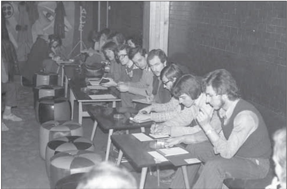
8. kép. Hangulatkép a Pincében (Fotó Tarjáni Antal, 1975)