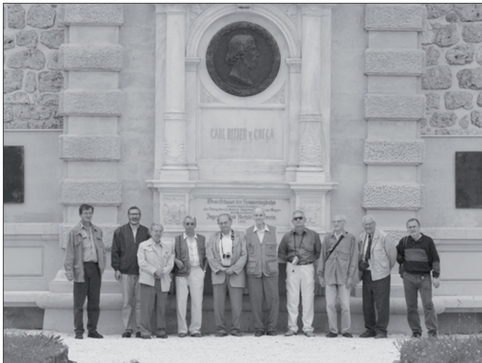
2. kép. A Kitaibel Pál Természettudományi Asztaltársaság kirándulása a Semmeringre 2005. június 18-án, az 535. összejövetel alkalmából

előadásokkal örvendeztette meg asztaltársait, érdeklődő hallgatóságát: A szecesszió / Észak-Olaszország építészete / A mannheimi csarnok / Rokokó bútor / Posztmodern építészet / Az építészet és a mérnök / A SOTEX kultúrház 50 évvel ezelőtti tragédiája / Vicenza-környéki villák / Bauhaus. Mint a hazai műemlékvédelem megszállott patrónusa több előadást szentelt e témakörnek is, felhívta a figyelmet pusztuló kultúrtörténeti értékeinkre, a közeljövő tennivalóira. Elhangzott előadásai e témakörben: Tájvédelem Angliában / A Lőverek jellegvédelme / A legújabbkori műemlékek védelme.