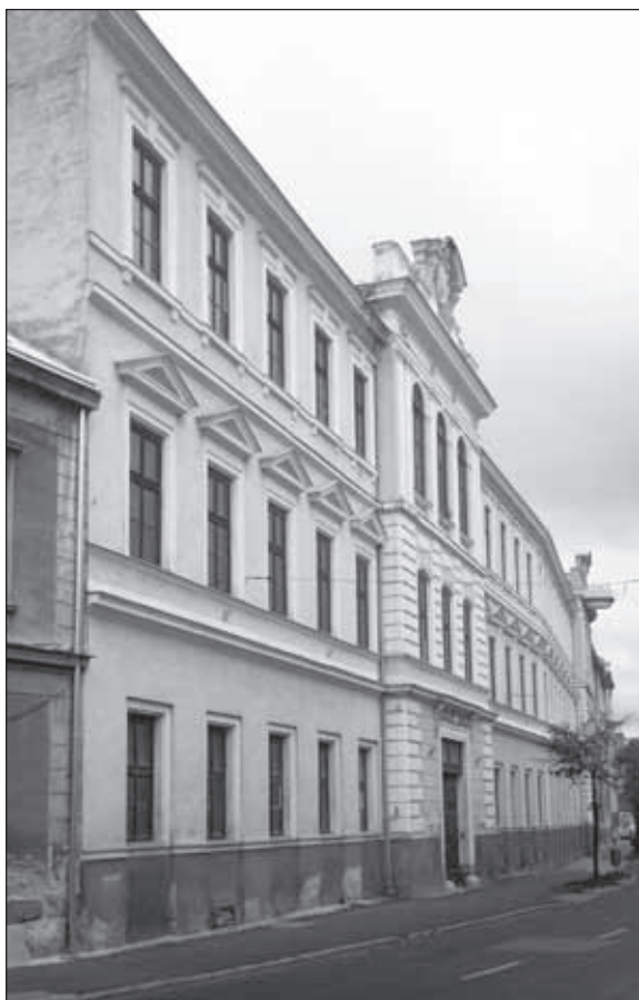
1. kép. A Rákóczi u. 8. utcai homlokzata 2016-ban.

Győr-Moson-Sopron Megye Soproni Levéltárában fennmaradt végrendelete, valamint a halálát követő hagyatéki eljárás és bírósági végzés iratai. 7 Nagyobb birtoktesttel Farádon