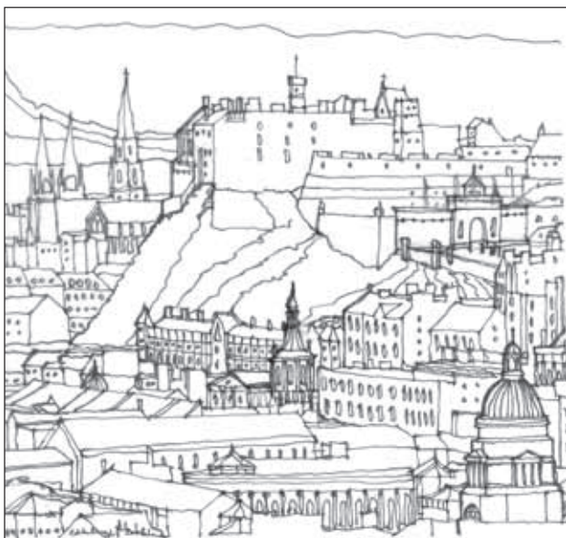
1. kép. „Az ICOMOS tanácsadó testülete ülésének 2006-ban Edinburgban adott helyet”