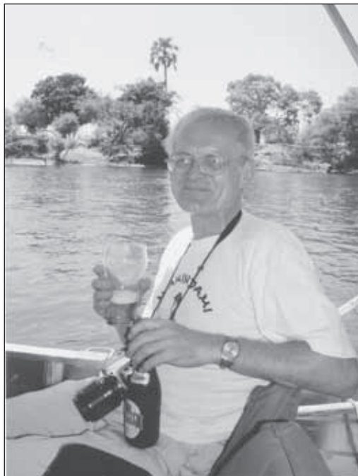
3. kép. Zimbabwe, a Zambézi folyón, az ICOMOS tanácsadó testületének 2003. évi ülése alkalmából (fotó: Fejérdy Tamás)

Az ICOMOS 2003-ban a közép-afrikai Zimbabweben, a Viktória vízesés mellett (3-4. kép), majd 2005. október 17-28. között pedig Kínában (Xi'an) tartott közgyűlést (5. kép). Mindkét rendezvényen több fős magyar küldöttség képviselte hazánkat, ott készültek az itt közölt fényképek Gáborról.