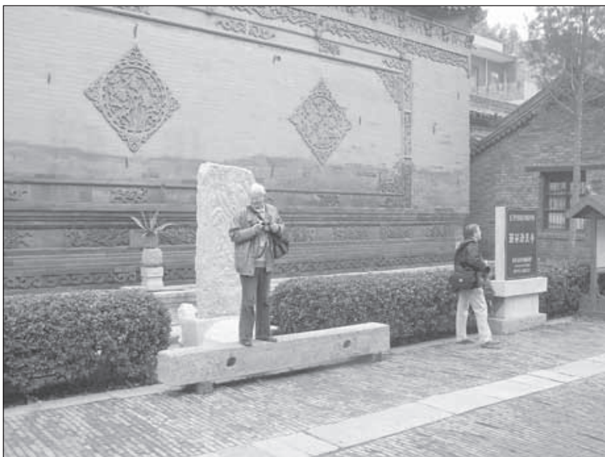
5. kép. A 2005-ös xi'ani ICOMOS közgyűlés egyik helyszínén