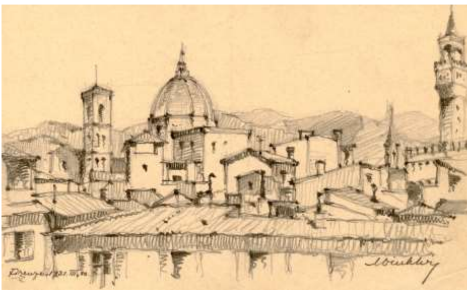
3. kép. Winkler Oszkár: Firenze, 1932