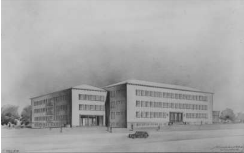
4. kép. Winkler Oszkár: az Evangélikus Tanítóképző új épületegyüttese a mai Bajcsy-Zsilinszky utcában, 1942

után 1957-ben ismét munkába állt. Házasságukból 1941-ben Gábor, 1942-ben András, 1945-ben Zsuzsika, 1946-ban Barnabás és 1950-ben István született.