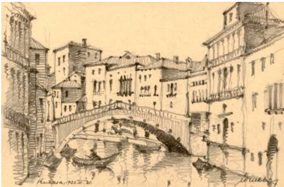
2. kép. Winkler Oszkár: Velence, 1932